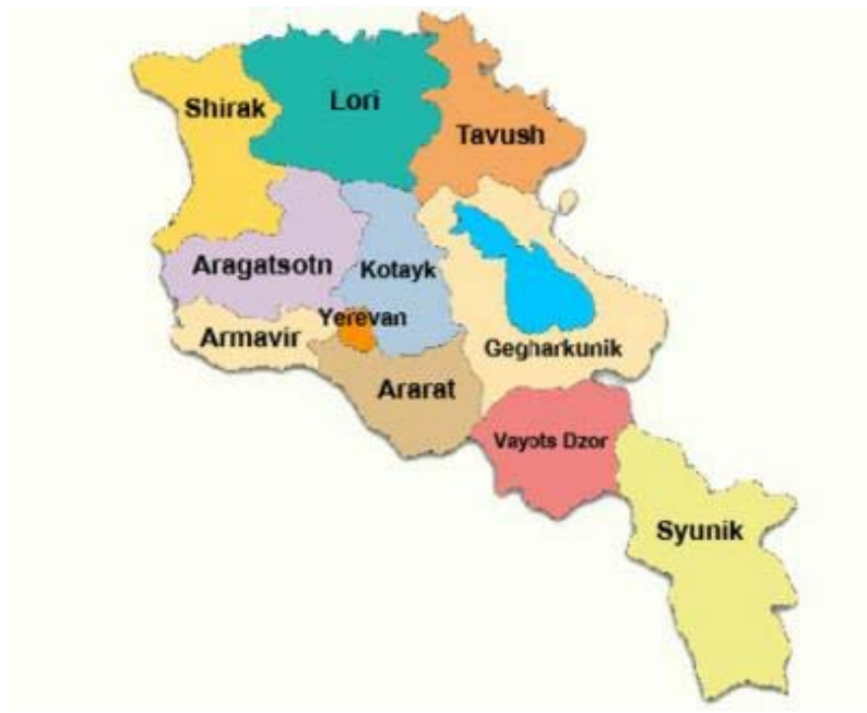
Պատկեր 1 Կոտայքի մարզը և Հայաստանի այլ մարզերը

Հայաստանի Հանրապետության Քաղաքաշինության Նախարարությունը (“ՔՆ”) դիմել է Վերակառուցման և Զարգացման Եվրոպական Բանկին (“ՎԶԵԲ” կամ “Բանկ”) Կոտայքի մարզում տարածաշրջանային սանիտարական աղբավայր նախագծելու և ֆինանսավորելու խնդրանքով: Սա կլինի առաջին սանիտարական աղբավայրը երկրում: Կոտայքի տարածաշրանը ընտրվել է Երևանին մոտ գտնվելու պատճառով՝ նպատակ ունենալով ստեղծել ցուցադրական նախագիծ ողջ երկրի համար (Պատկեր 1). Նախագիծը կմեղմացնի բնապահպանական վտանգը և կդիմակայի բացասական ազդեցությանը հողի և ջրային ռեսուրսների վրա: ՔՆ-ը նպատակ ունի կառուցել երկրին ծառայող յոթ տարածաշրջանային սանիտարական աղբավայր: